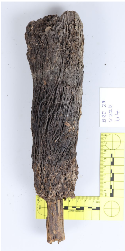
De boender uit de Breestraat, 16 e eeuw

Hij heeft waarschijnlijk bij één van de huishoudens daar gehoord en is op een gegeven moment bij het afval terechtgekomen.