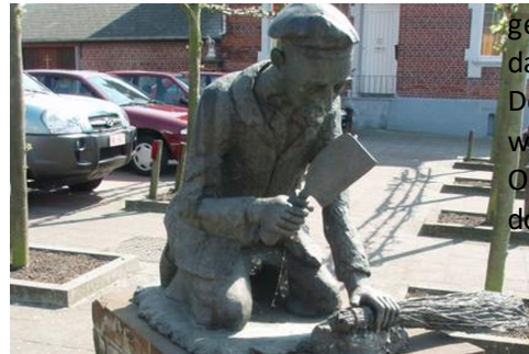
Beeld van een bezembinder in Schoonderbaken, België

worden ze frequent gebruikt. Daarna verdwijnen ze langzaam maar zeker uit beeld, maar pas in de jaren '60 van de vorige eeuw verdwijnen ze echt doordat er steeds meer producten van kunststof komen. Nu is alleen de achternaam Bezembinder nog over. En vondsten zoals onze heiboender natuurlijk.