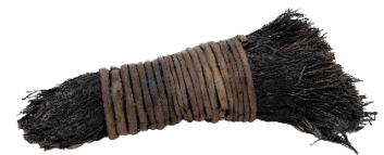
Heidebezem, 1575-1625, Rotterdam

Boenders maken in regio's met veel heide is vaak een bijverdienste. Het zijn meestal boeren die het naast hun eigenlijke werk doen. Hun kinderen leren het van jongs af aan.