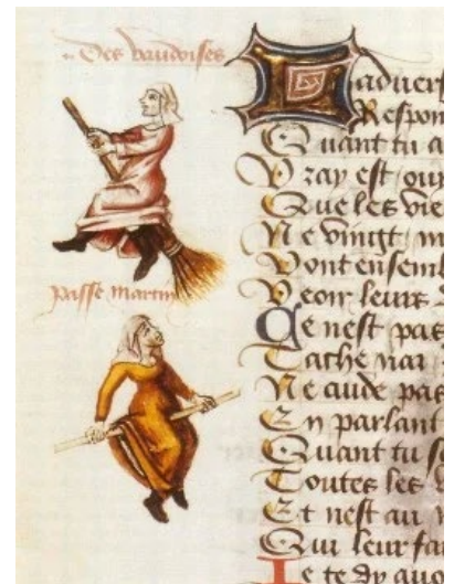
Heksen op een bezem uit een handschrift van Martin le France, Le champion des dames, 1451

Vanaf de 15 e eeuw ontstaat er zoiets als een beeldcultuur rondom heksen. In schilderijen, prenten, houtsneden enz. gaan kunstenaars ze meer en meer weer geven als vrouwen die op een bezem, stok of een dier door de lucht vliegen.